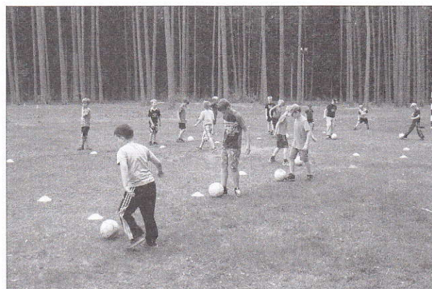
Igal kevadel on algkooli lapsed spordilaagris – ÜG tulevikulootused.