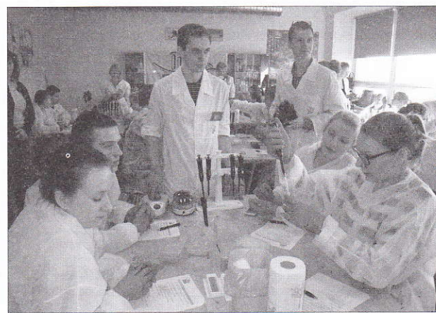
Loodusharu õpilased programmis Rändav Bioklass.