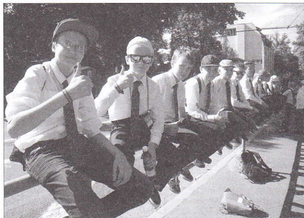
ÜG kooride kõrghetk on osalemine laulupeol – laulupoisid lauluõrrel.