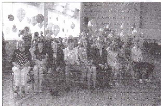
Lõbus hetk enne riigieksamite algust – üheksandikud on ellu astumas!