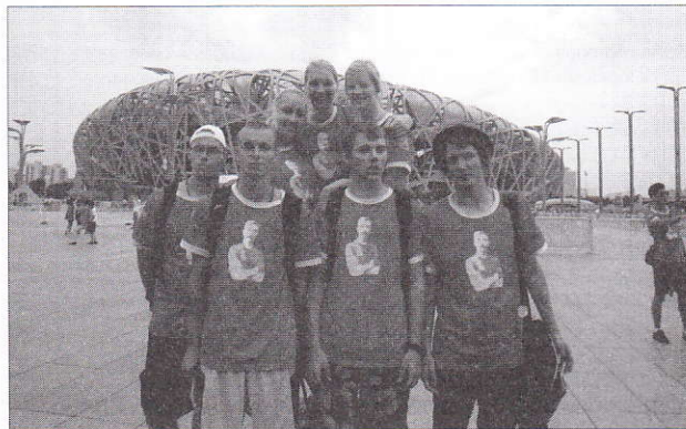
ÜG osalejad Pierre de Coubertini koolide Noortefoorumil Pekingis 2011. aastal olümpiastaadioni taustal.