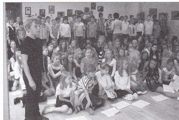
Algkoolilapsed kevadises laululaagris.