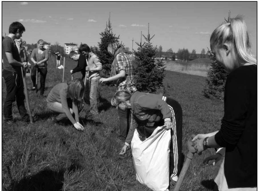
Istutades oled õnnelik!