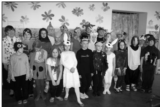
3. mail pärast lastevanematele esinemist. Noored näitlejad etendasid metsaeurovisioni kokku viiel korral.