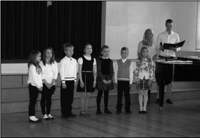
1. klassi õpilaste tervituslaul