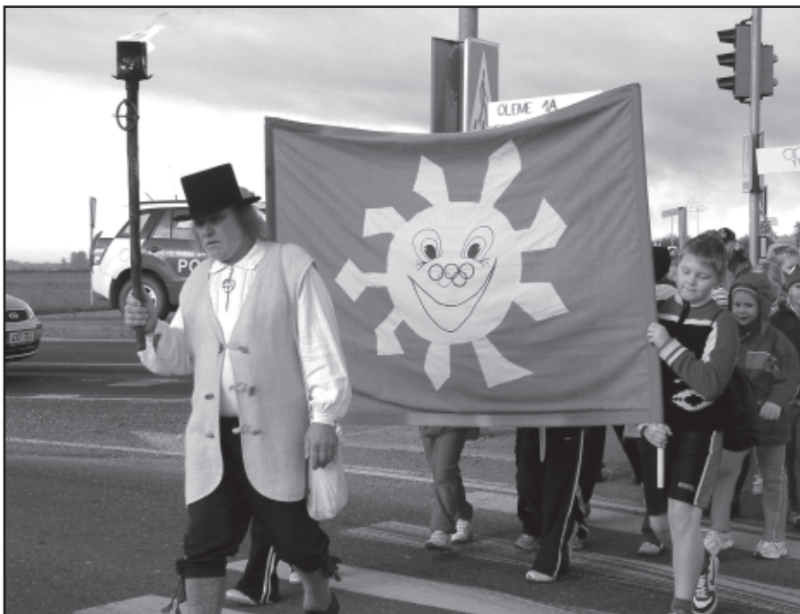
Olümpiatule teekond Tõrvandist Ülenurme