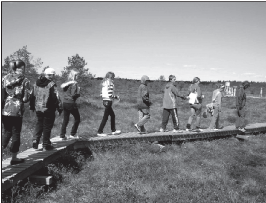
Endla rabas taimi uudistamas

Järgmisel hommikul võtsime suuna Endla rappa, kus giid tutvustas meile erinevaid rabataimi. Olime neid juba loodusõpetuses õppinud, nii et